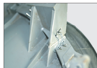
Скобы угловые 0.8 мм для ремонта внутренних и внешних углов крепёжных элементов.