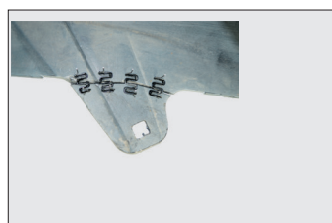
Волнистые скобы с крупной и мелкой змейкой 0.6 мм для ровных поверхностей на тонком пластике.