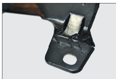
Волнистые скобы с крупной и мелкой змейкой 0.8 мм для ровных поверхностей, подверженных нагрузкам и вибрации.